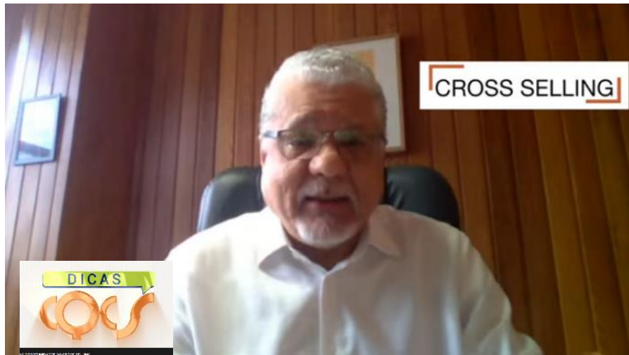
Programa CQCS Dicas